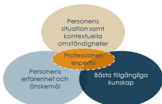
Figur 2. Modell för evidensbaserad praktik.

Alla aktiviteter som FoU Jämt genomför görs med utgångspunkt i en evidensbaserad praktik.