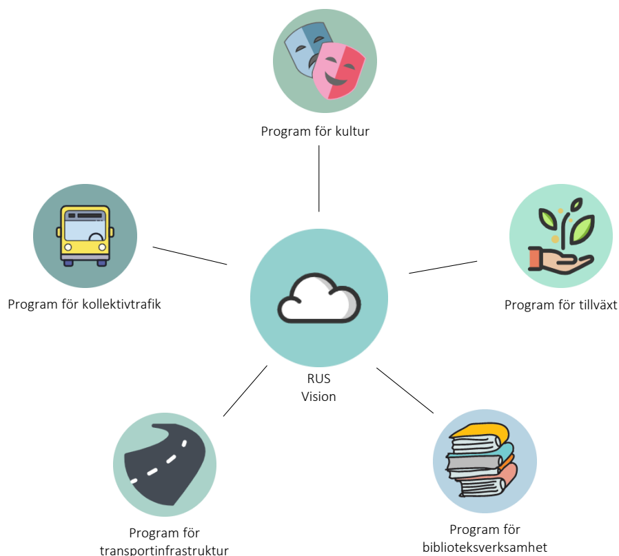
Bild 1: Beskrivning av hur den övergripande omställningen påverkar den Regionala utvecklingsstrategin och kopplingen till Region Jämtland Härjedalens uppdrag inom regional utveckling.

Region Jämtland Härjedalens regionala utvecklingsnämnd ansvarar för politikområdena: regional biblioteksverksamhet, regional kulturverksamhet, kollektivtrafik och det regionala utvecklingsansvaret som kommer i två delar transportpolitik och tillväxtarbete.