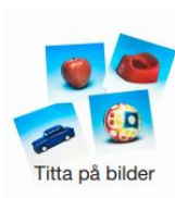
Titta på bilder